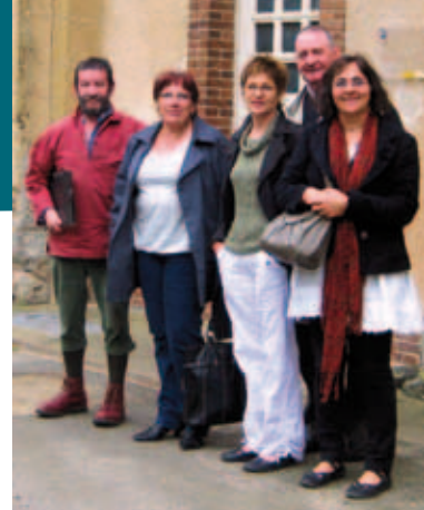
Les familles d'accueil.