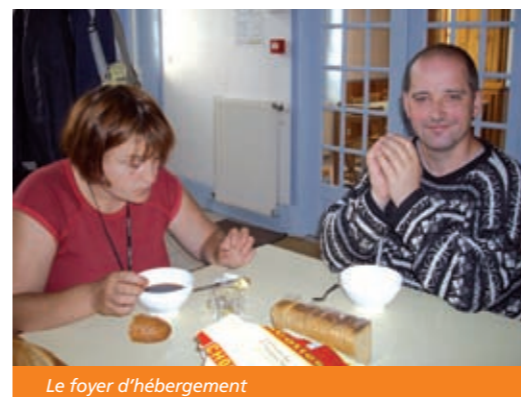
Le foyer d'hébergement

L'équipe du foyer se compose de trois AMP, 2.5 ASH surveillants de nuit, un contrat d'aide à l'emploi, une infirmière, une secrétaire et une directrice (intervenant à l'ESAT), un éducateur et une apprentie monitrice éducatrice. Leur travail repose sur l'accompagnement des résidents en vue de développer leur autonomie dans l'organisation de