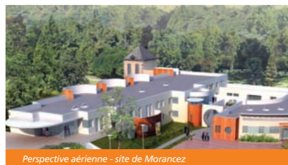
Perspective aérienne - site de Morancez