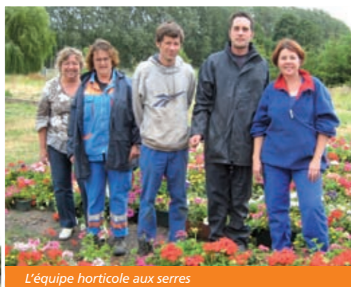
L'équipe horticole aux serres