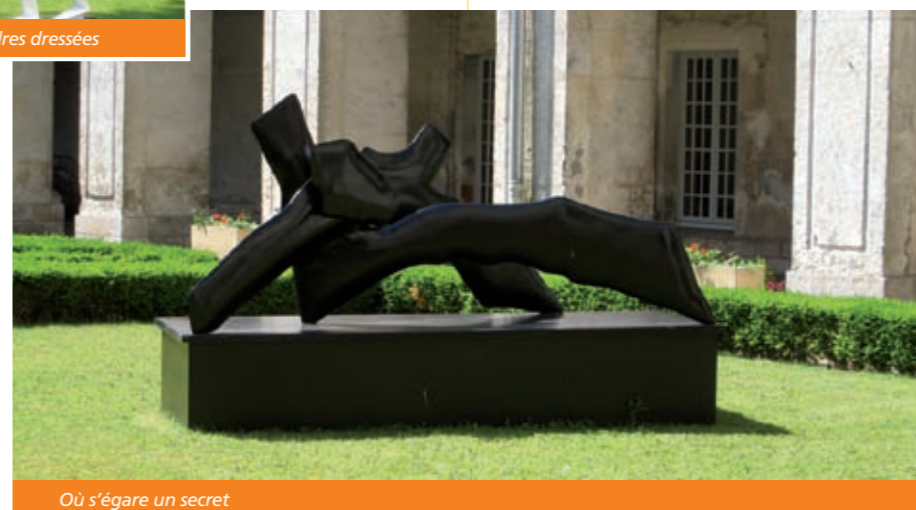
Où s'égarer un secret