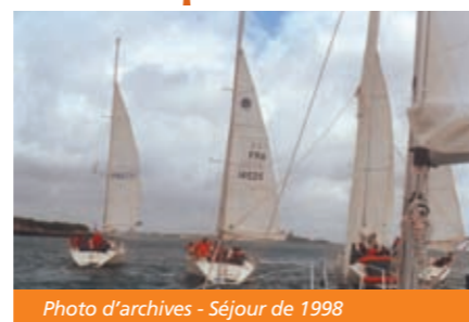
Photo d'archives - Séjour de 1998

Parcours initiatique qui utilise le vent comme fil conducteur, Voile en Tête s'adresse à des pathologies diverses. Les patients s'investissent dans des activités progressives qui se déroulent de façon régulière sur le plan d'eau de Montigny le Gannelon. Faire de la voile, c'est faire au moins comme tout le monde, et plus encore, c'est une chance de rejoindre les privilégiés