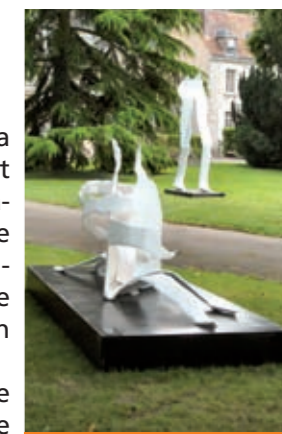
Indolemment comme des fleurs

L'Art permet un dialogue au-delà du temps « L'œuvre d'art, la sculpture, parce qu'elle n'est pas un repaire du réel, permet d'entrer en communication avec des choses éloignées de nous dans le temps et l'espace », nous témoigne-t-il. C'est l'artiste d'une époque qui vit à chaque moment dans les fractures du temps et de l'espace. C'est un expérimentateur : il l'a été dans sa peinture et il l'est de plus belle dans sa sculpture. « J'essaie de transmettre une vision ambivalente du monde, en créant des espaces brisés, des dimensions non définies ».