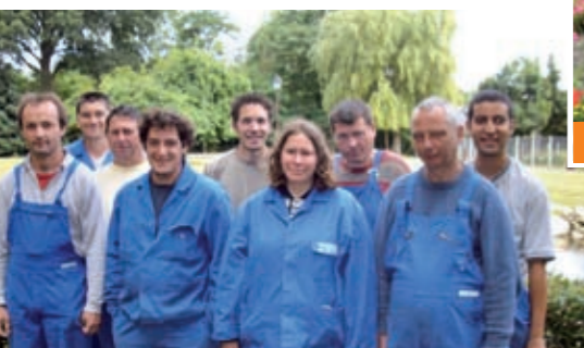
L'équipe espaces verts au moulin du pont à Bonneval

L'ESAT, établissement médico-social, accompagne les travailleurs orientés par la MDPH dans leur projet de réinsertion professionnelle ou sociale. L'ESAT a pour finalité l'autonomie et l'épanouissement de ces personnes par le travail. Ouvert depuis le 2 mai 2005, l'établissement dispose de 27 places. L'ESAT, budgets annexes du Centre Hospitalier Henri Ey est financé en partie par l'Etat et par ses recettes commerciales. Il est spécialisé en espaces verts et en horticulture. Le développement d'une activité pépinière, maraîchage biologique et ferme pédagogique est prévu. L'encadrement est pluridisciplinaire : une directrice, 5 moniteurs d'atelier, 2 aide moniteurs, une infirmière, un médecin, une Conseillère en Économie Sociale et Familiale (CESF) et une secrétaire.