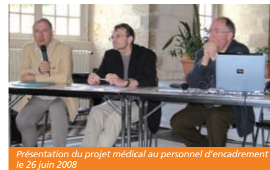
Présentation du projet médical au personnel d'encadrement le 26 juin 2008

Ces orientations sont complétées par les deux derniers axes qui concernent la prise en compte d'une réflexion sur les facteurs d'une meilleure attractivité de l'établissement et sur la mise en place d'un système de pilotage médicalisé.