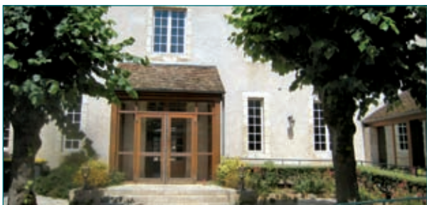
La maison de retraite «Les marronniers»

Ces différents projets vont représenter une dépense de l'ordre de 33 M€.