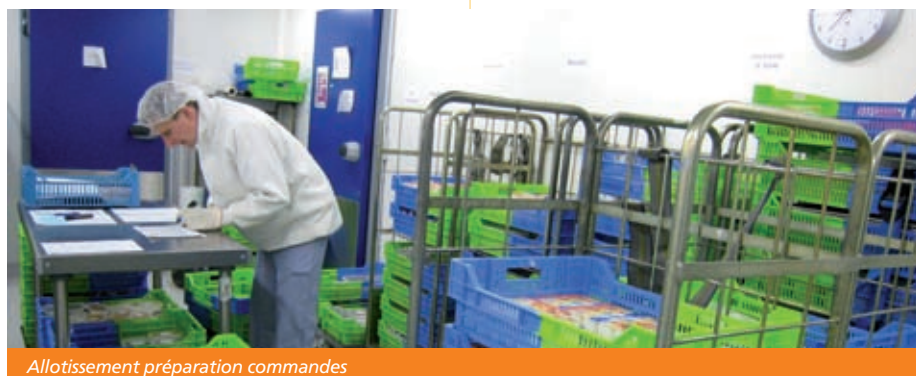
Allotissement préparation commandes

Le métier de cuisinier a considérablement évolué depuis plusieurs dizaines d'années. L'activité « cuisine » a diminué pour laisser place à un métier plus technique. Le cuisinier doit être capable de s'adapter à de nouvelles normes et procédures. Outre cet aspect très