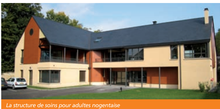
La structure de soins pour adultes nogentaise

Le nouveau bâtiment est doté d'un rez-de-chaussée et d'un étage totalement accessibles aux personnes à mobilité réduite. Il s'inscrit à proximité de la structure Infanto-Juvenile et représente une surface de plancher de 530 m 2 . Le rez-de-chaussée est dédié au CMP et l'étage à l'Hôpital de Jour. Le bâtiment, de style contemporain et habillé d'un bardage en bois, est recouvert d'un enduit de couleur chaude. Il a été conçu par l'architecte Frédéric GAU qui était intervenu sur le bâtiment Les Vallées à Bonneval. L'opération a représenté une dépense globale de 1,5 M€.