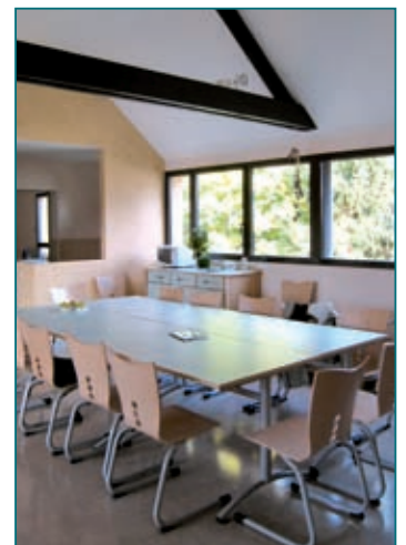
La salle de restauration de l'hôpital de jour