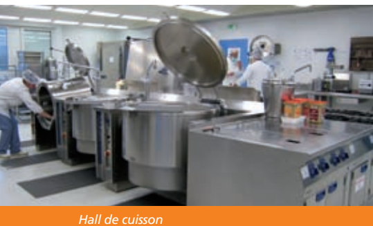
Hall de cuisson

Dotée d'une capacité de production de 3 000 repas/jour, la cuisine produit aujourd'hui environ 1500 repas/jour. Le service restauration, composé de 25 agents, regroupe divers corps de métiers : chef de production culinaire, chefs d'ateliers, opérateurs, diététiciennes dont une assistante chargée de la qualité interne, livreurs, personnel de salle.