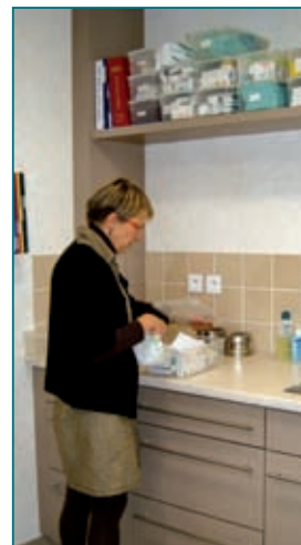
La salle de soins du CMP

Cette ouverture concrétise le travail mené avec les équipes concernées depuis quelques années. Mais ce n'est pas la seule.